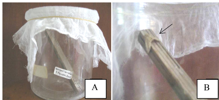
Gambar 4. Tempat perbanyakannya imago dan pupa (A), Imago (ngengat) ulat jengkal betina sedang meletakkan telur di rongga bambu (B).