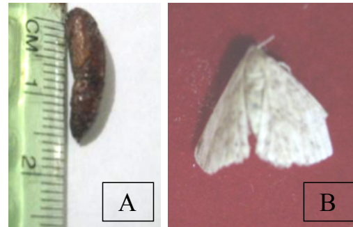
Gambar 3. Pupa ulat jengkal berwarna coklat tua (1,5 cm) (A), Imago (ngengat) ulat jengkal betina (2 cm) (B).