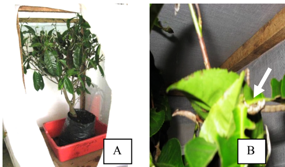
Gambar 2. Pohon teh sebagai pakan ulat jengkal (A), Ulat jengkal instar 6 pada kotak perbanyakannya (B).

Pengujian toksisitas isolat B. thuringiensis dilakukan di rumah kaca. Pada tahap awal disiapkan botol kaca berisi larutan fisiologis dan tangkai pucuk teh. Suspensi B. thuringiensis yang telah disiapkan, insektisida kimia, dan bioinsektisida B. thuringiensis komersial disemprotkan pada pucuk teh dan dikering-anginkan. Pucuk teh yang telah diberi perlakuan dimasukkan ke dalam kotak kaca bersama dengan 10 larva ulat jengkal kemudian ditutup kain kasa (Gambar 5). Kotak kaca berisi tanaman perlakuan yang telah ditutup dengan kain kasa disusun secara acak kelompok. Pengamatan dilakukan hingga 10 hari terhadap jumlah kematian larva dan residu sipermetrin dalam pucuk teh yang telah diberi perlakuan. Tingkat kematian larva H. talaca terdapat pada Tabel 3.