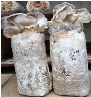
Gambar 2. Tubuh buah jamur tiram: a) P. sajor-caju dan b) P. pulmonarius pada media baglog yang difortifikasi Se 100 ppm