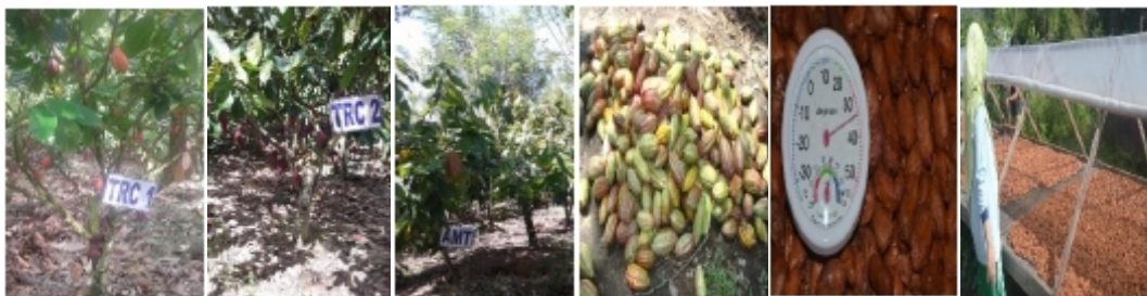
Gambar 2b. Kondisi tanaman setelah dilakukan pengendalian dengan agensia hayati Figure 2b. Crop conditions after the controlling of the biological agents