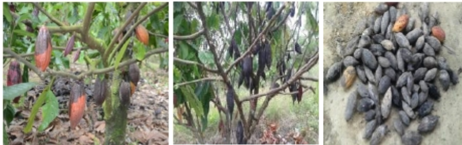
Gambar 2a. Kondisi tanaman terserang penyakit busuk buah sebelum pengendalian dengan agensia hayati Figure 2a. Crop conditions of fruit rot disease prior to the controlling of the biological agents

Notes: Attack cocoa pod disease controlled with biological agents ( Trichoderma harzianum DT/38 and T. pseudokoningii DT/39, T. asperellium Specific Sultra, T. Wis Groows ) and dithiocarbamates. The figures followed the same small letters in the same column, and figures followed the same capital letters on the same line are not significantly different by Duncan range test at \alpha = 0.05 .