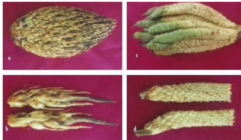
Gambar 2. (a) Buah kelapa sawit mantel berat bersayap; (b) bentuk buah bersayap; (c) bunga jantan; (d) bunga jantan steril