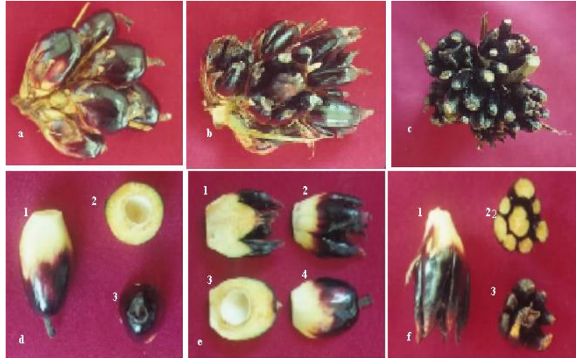
Gambar 1. Buah kelapa sawit dari tanaman klonal hasil kultur jaringan (a) buah normal; (b) buah mantel ringan; (c) buah mantel berat; (d) buah normal dan penampang melintang (d2 & 3); (e) penampang melintang dan membujur buah matel ringan (e1 & 2) dan buah normal (e3 & 4); (f) buah mantel berat-bersayap (f1), penampang melintang (f2) dan tampak atas (f3).